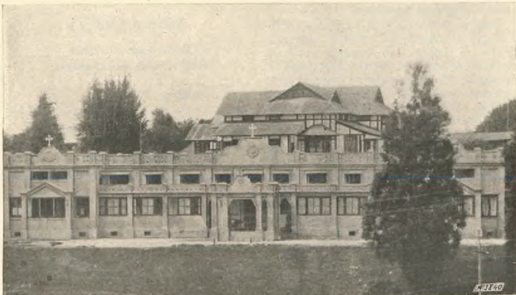
Shillong. - La scuola superiore e l'orfanotrofo femminile.

Dato l'esiguo numero degli operai evangelici,