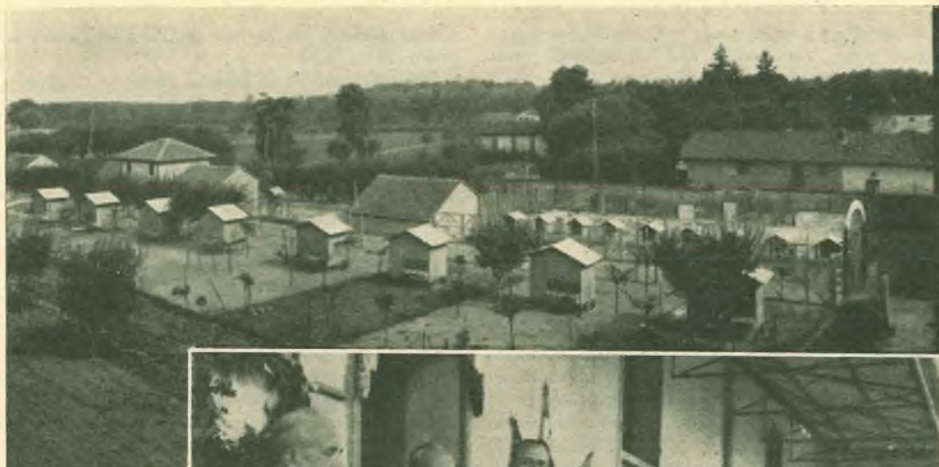
S. A. R. il Principe di Piemonte Um- berto di Savoia alla nostra Scuola Agri- cola di Lombriasco.