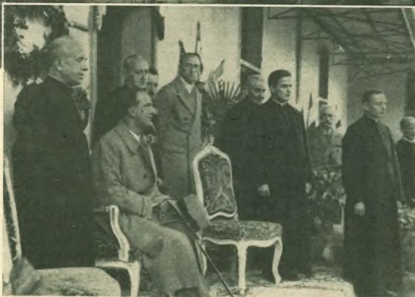
Vedute parziali del- l'Istituto - Istan- tanea durante l'o- maggio all'Augusto Principe.