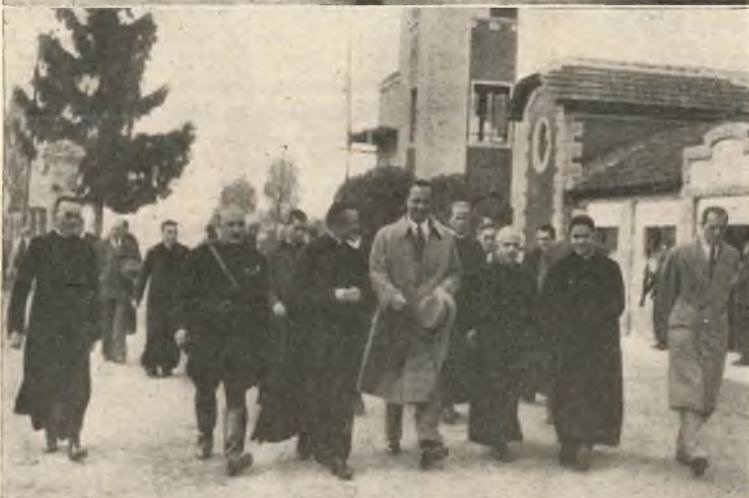
Da l'alto in basso: Arrivo di S. A. R. - Attraverso il cortile - In visita al potere.

province di Cuneo e di Torino, che corsero numerose a visitarli, le grandi risorse economiche di allevamenti fatti con criteri pratici e razionali.