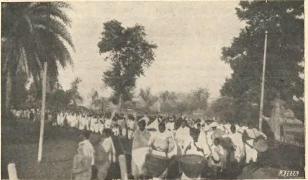
Assam. - Una processione.