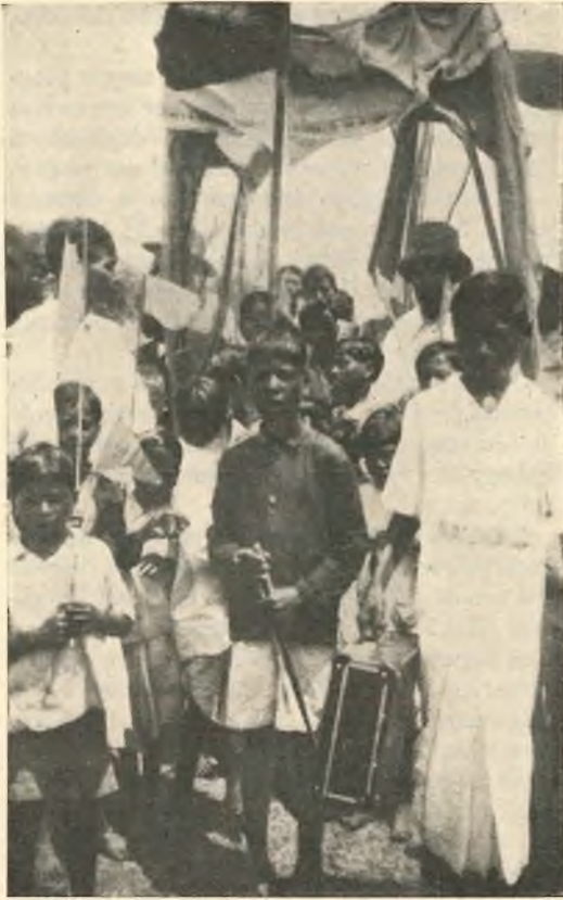
Assam. - L'arrivo del Vescovo in un villaggio.

intensificheremo tra i cristiani la piet  Eucaristica e la devozione a Maria Ausiliatrice; e confidiamo che si opereranno quei miracoli che San Giovanni Bosco prometteva a chi propagava queste due divozioni.