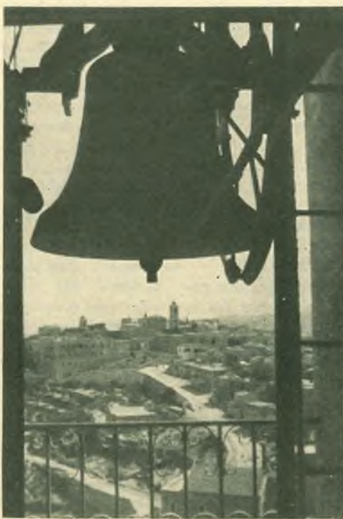
Betlemme. - La campana della chiesa salesiana annuncia il Natale salutando, all'orizzonte, la Basilica della Natività.

Così S. E. Mons. Costantini ha intitolato il messaggio trasmesso a tutto il mondo cattolico per la « Giornata missionaria » dello scorso ottobre. E il titolo, mutuato da S. Paolo, sviluppato nel testo con pratiche e commoventi indicazioni, valse a richiamare le anime ad innumerevoli industrie a vantaggio dell'apostolato missionario, rivelando ancora una volta le preziose risorse della carità quando è servita da un buon ingegno. Si può dire infatti che l'ingegno si aguzza spontaneamente e generosamente a servizio della carità, quando esso stesso non si ribella all'influsso naturale della bontà. Mentre gli uomini non rendono generalmente tutto quello che potrebbero, nel campo sociale soprattutto, quando, soffocando gli istinti naturali della bontà, non impegnano sufficientemente il loro ingegno allo sviluppo della carità nell'amore del prossimo. Il che viene dal fatto